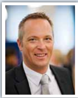
Urban Arvidsson Chef JENSEN vuxenutbildning